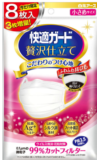
快適ガード贅沢仕立て 小さめサイズ5+3枚入