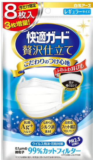
快適ガード贅沢仕立て レギュラーサイズ5+3枚入

『快適ガード』シリーズの販売強化を図っていくことで、市場のさらなる活性化を目指してまいります。