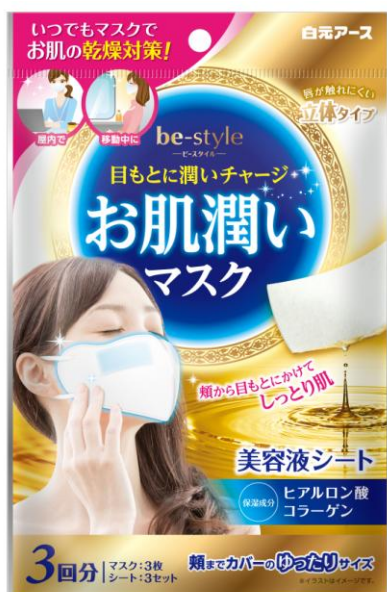
ビースタイル お肌潤いマスク 3セット入