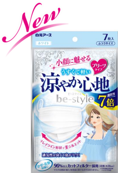
ビースタイル プリーツタイプ 涼やか心地 7枚入