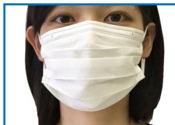
快適ガード さわやかマスク ふつうサイズ