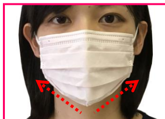
ビースタイル プリーツタイプ ふつうサイズ

「縦プリーツ」と「引き上げタック」によって、頬からアゴにかけてのマスクの膨らみを抑え、アゴのラインがシャープになり、美しいシルエットになります。