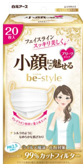
ビースタイル プリーツタイプ プレミアムホワイト20枚入