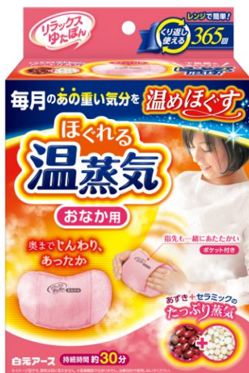
リラックスゆたぽん おなか用 ほぐれる温蒸気

たっぷり蒸気でおなかを包み込み、奥までじんわり温めることで毎月のあの重い気分をほぐします。