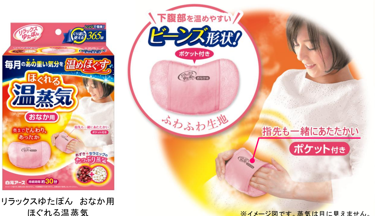
リラックスゆたぽん おなか用 ほぐれる温蒸気

たっぷり蒸気でおなかを包み込み、奥までじんわり温めることで毎月のあの重い気分をほぐします。