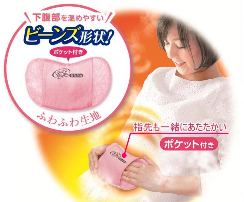
※イメージ図です。蒸気は目に見えません。