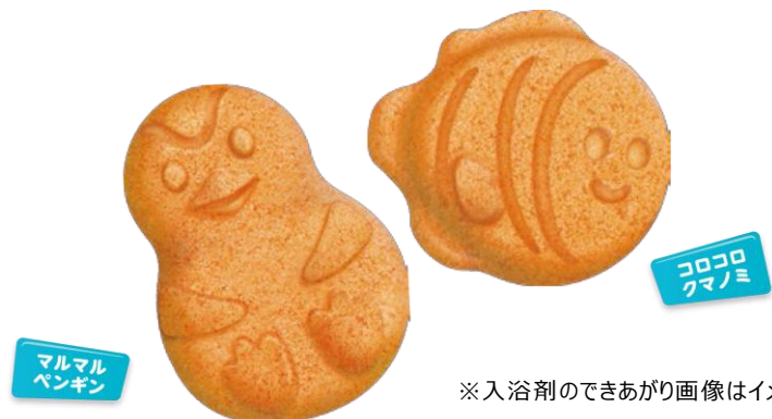
※入浴剤のできあがり画像はイメージです