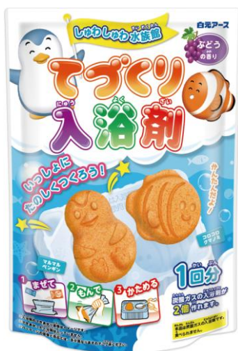
てづくり入浴剤 しゅわしゅわ水族館 ぶどうの香り