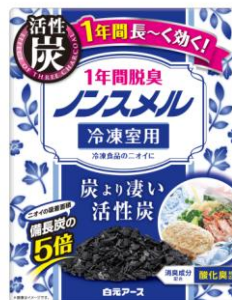
ノンスメル冷凍室用置き型 1年間脱臭