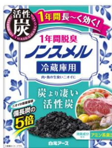
ノンスメル冷蔵庫用置き型 1年間脱臭

※冷蔵庫の肉、魚のニオイ(アミン系臭)、冷凍室の冷凍食品のニオイ(酸化臭)、野菜室のニラ、ネギのニオイ(イオウ系臭)