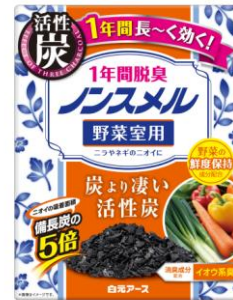
ノンスメル野菜室用置き型 1年間脱臭