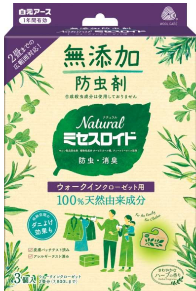
Naturalミセスロイド ウォークインクローゼット用3個入

白元アースは、今後も多様化する収納環境・お客様のニーズに対応した商品をご用意いたします。