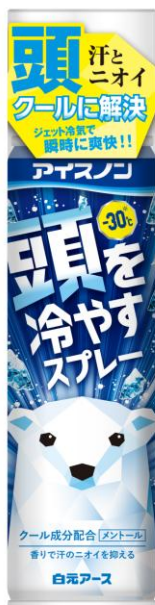
夏、帽子やヘルメットなどをかぶっている 暑さを感じることはありますか？