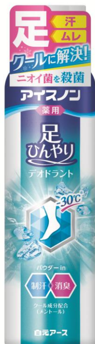
アイスノン 足ひんやりデオドラント