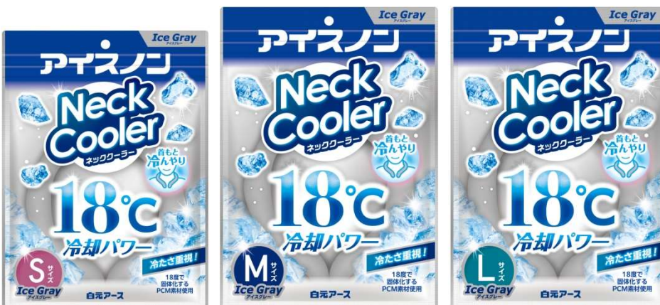
アイスノン ネッククーラー アイスグレー Sサイズ/Mサイズ/Lサイズ