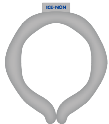
本体イメージ (Lサイズ)