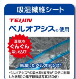
ドライ&ドライUP 翌朝スツキリシート パンツ・スラックス用