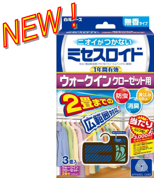
ミセスロイド ウォークインクローゼット用

そこで、新たな用途としてウォークインクローゼットの広い空間に対応し、さらに「消臭機能」「黄ばみ防止機能」も加えた多機能な『ミセスロイドウォークインクローゼット用』を発売します。多様化する収納環境・お客様のニーズに対応した商品をご用意して参ります。