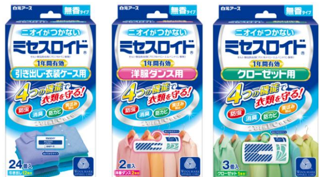
ミセスロイド (引き出し用/洋服ダンス用/クローゼット用)