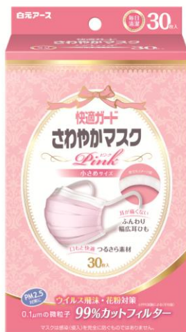
快適ガード さわやかマスク 小さめサイズ ピンク30枚入