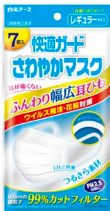
レギュラーサイズ