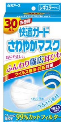
レギュラーサイズ