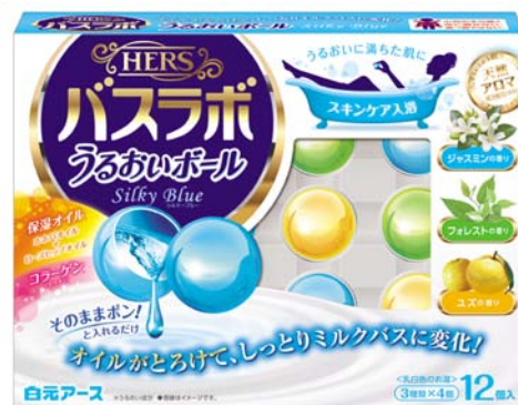
HERSバスラボ うるおいボール12個入 シルキーブルー