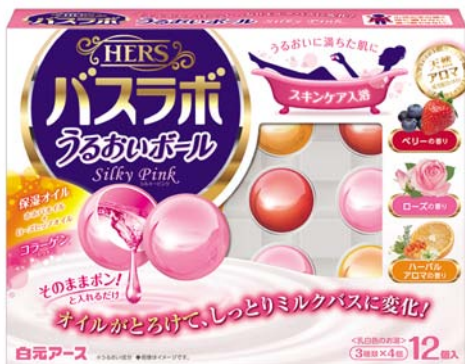
HERSバスラボ うるおいボール12個入 シルキーピンク

白元アースは、目新しい形状のスキンケア入浴剤を発売することで市場の活性化を目指してまいります。