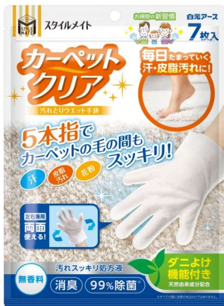
スタイルメイト カーペットクリア 汚れとりウエット手袋