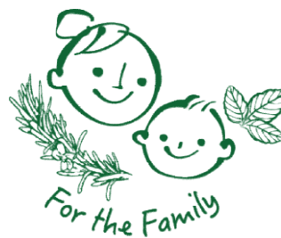
Naturalミセスロイド 衣類ケアミスト