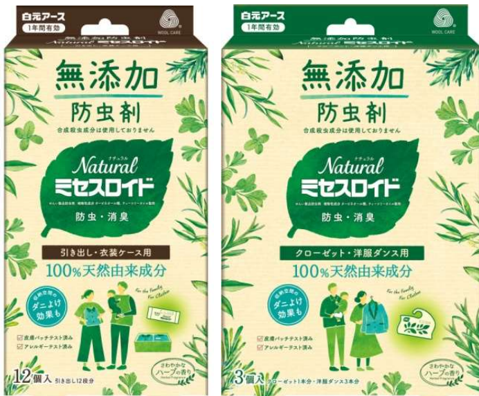
Naturalミセスロイド 引き出し用／クローゼット・洋服ダンス用