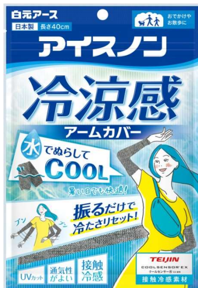
アイスノン 冷涼感アームカバー