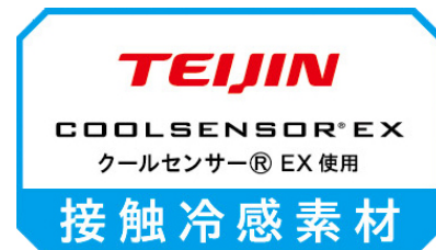
アイスノン 極冷えタオル

『アイスノン 極冷えタオル』は、水にぬらして、しぼって振るだけで、冷たいタオルに早変わりする商品です。また、冷たさを感じなくなったら、タオルを再び振ることで、冷たさが復活し、乾くまでくり返し使えます！