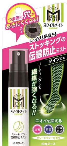
ミセスロイド スタイルメイト ストッキングの伝線防止ミスト

日常使いにはもちろん、お気に入りのストッキングも長持ちさせ、思いっきりおしゃれを楽しみたい女性を応援します。