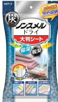
ノンスメルドライ大判シート

ふとんを長期収納する時や押し入れ・衣装ケースなどの収納空間について、多くの方が湿気とともにニオイも気になっていることがわかりました(当社調べ)。そこで今回、除湿剤のロングセラーブランド「ドライ&ドライ UP」シリーズの『ふとん用』『大判シート』を、ニオイ対策もできる除湿剤ブランド「ノンスメルドライ」シリーズとしてリニューアルし、発売いたします。新たに活性炭を配合してパワーアップし、パッケージは除湿と脱臭を強く訴求したデザインに仕上げております。