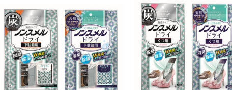
ノンスメルドライ下駄箱用 ノンスメルドライくつ用

家の中の気になる湿気とニオイ対策として生まれた『ノンスメルドライ』シリーズ。“機能性”に“おしゃれ感”をプラスし、快適に安心して収納できる商品を提案してまいります。