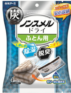
ノンスメルドライふとん用

白元アース株式会社(本社:東京都 台東区、社長:吉村一人)は、気になるニオイをしっかりと脱臭する除湿剤『ノンスメルドライふとん用』『ノンスメルドライ大判シート』を9月1日より新発売いたします。