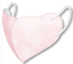
be-style UVカットマスク シャインピンク