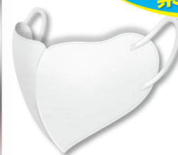
be-style UV カットマスク ホワイト