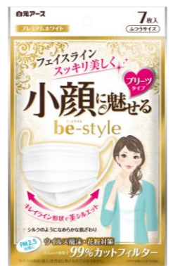
ビースタイル ふつうサイズ