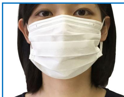
快適ガード さわやかマスク ふつうサイズ