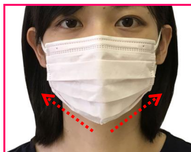
ビースタイル プリーツタイプ ふつうサイズ

「縦プリーツ」と「引上げタック」によって、頬からアゴにかけてのマスクの膨らみを抑え、アゴのラインがシャープになり、美しいシルエットになります。