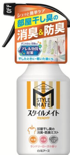
ミセスロイド スタイルメイト 部屋干し臭の消臭・防臭ミスト

香りは柔軟剤の香りを邪魔しないランドリーローズ(微香性)を採用しました。ボトルは、スタイルメイトのブランドロゴを大きくあしらった、お部屋に馴染むシンプルなデザインです。