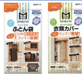
衣類・収納空間ケア

消費者の方のお問い合わせ 白元アース株式会社 お客様相談室 TEL 03-5681-7691