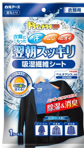
ドライ&ドライUP 翌朝スツキリシート衣類用

白元アースは、新しい使用シーンの除湿剤を発売することで市場の活性化を目指してまいります。