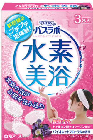
HERSバスラボ 水素美浴