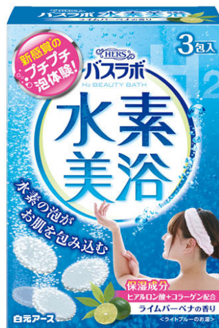
HERSバスラボ 水素美浴