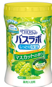
HERS バスラボボトル マスカットの香り680g