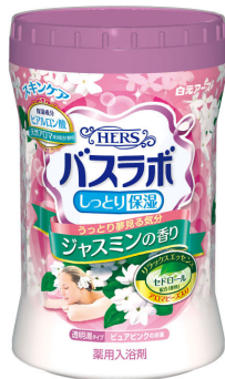
HERS バスラボボトル ジャスミンの香り680g