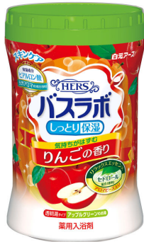
HERS バスラボボトル りんごの香り680g

天然精油シダーウッドオイルなどに含まれる成分で、一般的に気分がリラックスするといわれています。